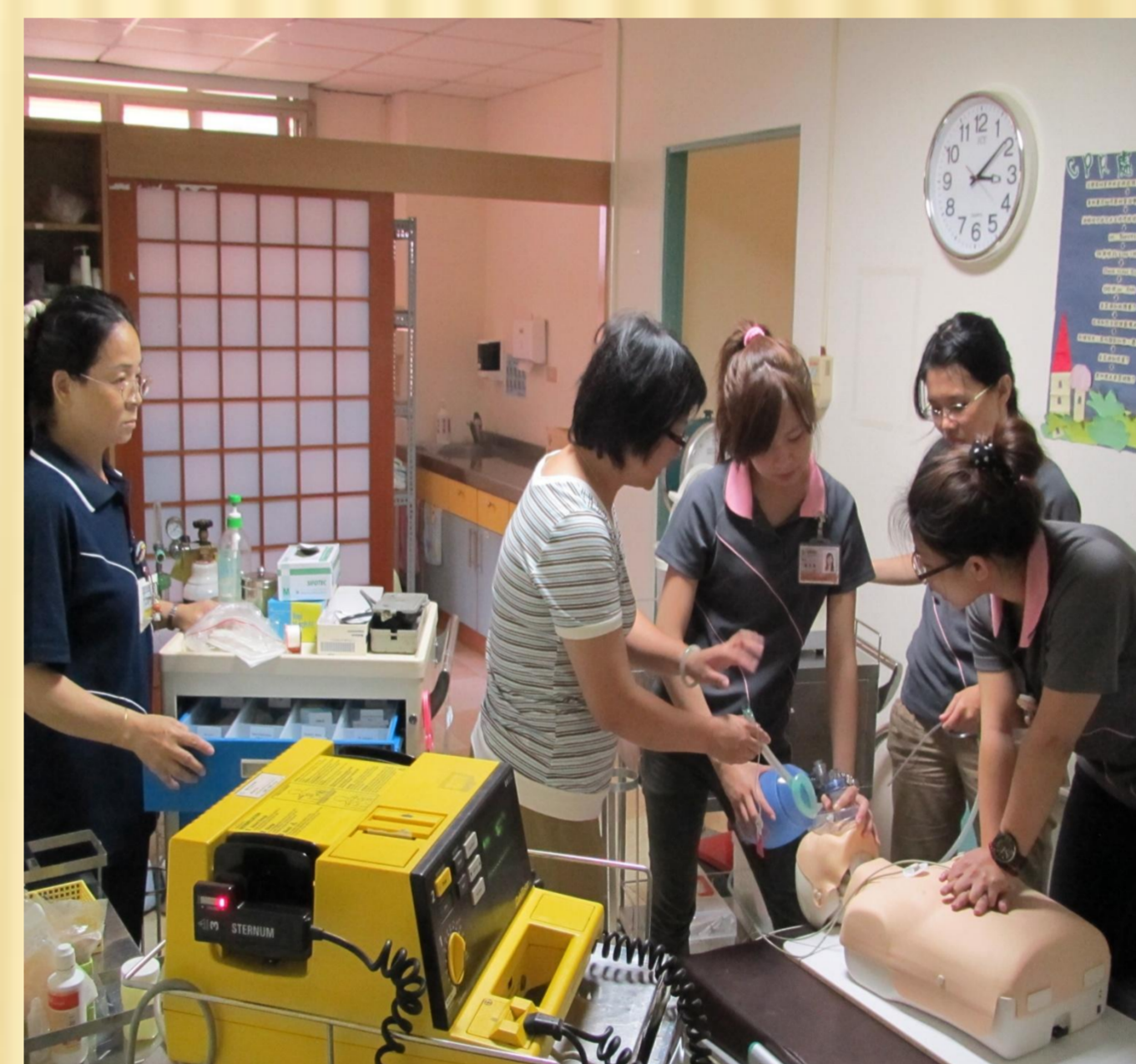
急救過程實地演練