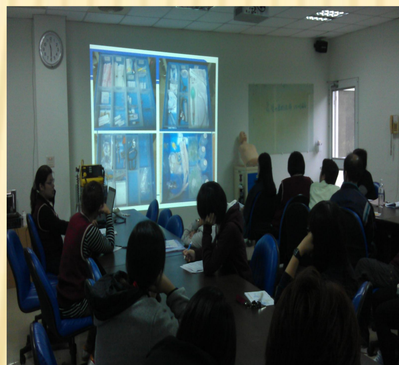
院內急救課程在職教育 (急救車統一格式圖)