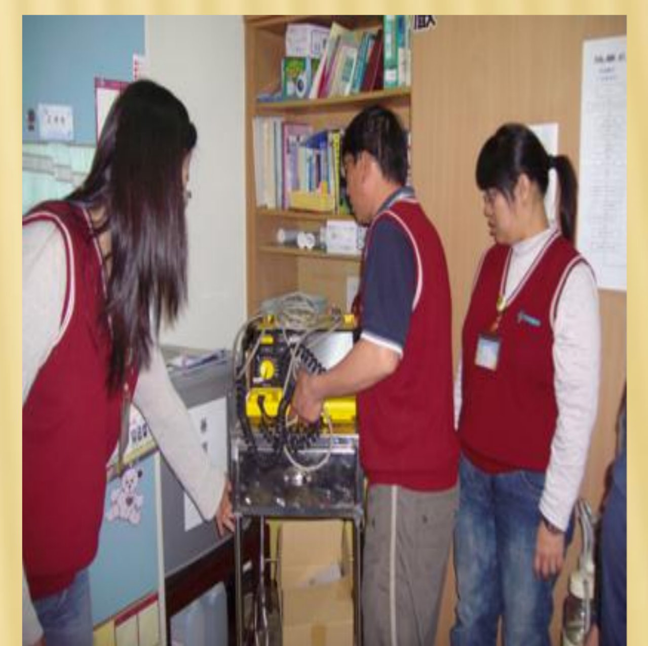
搬運電擊器實地演練